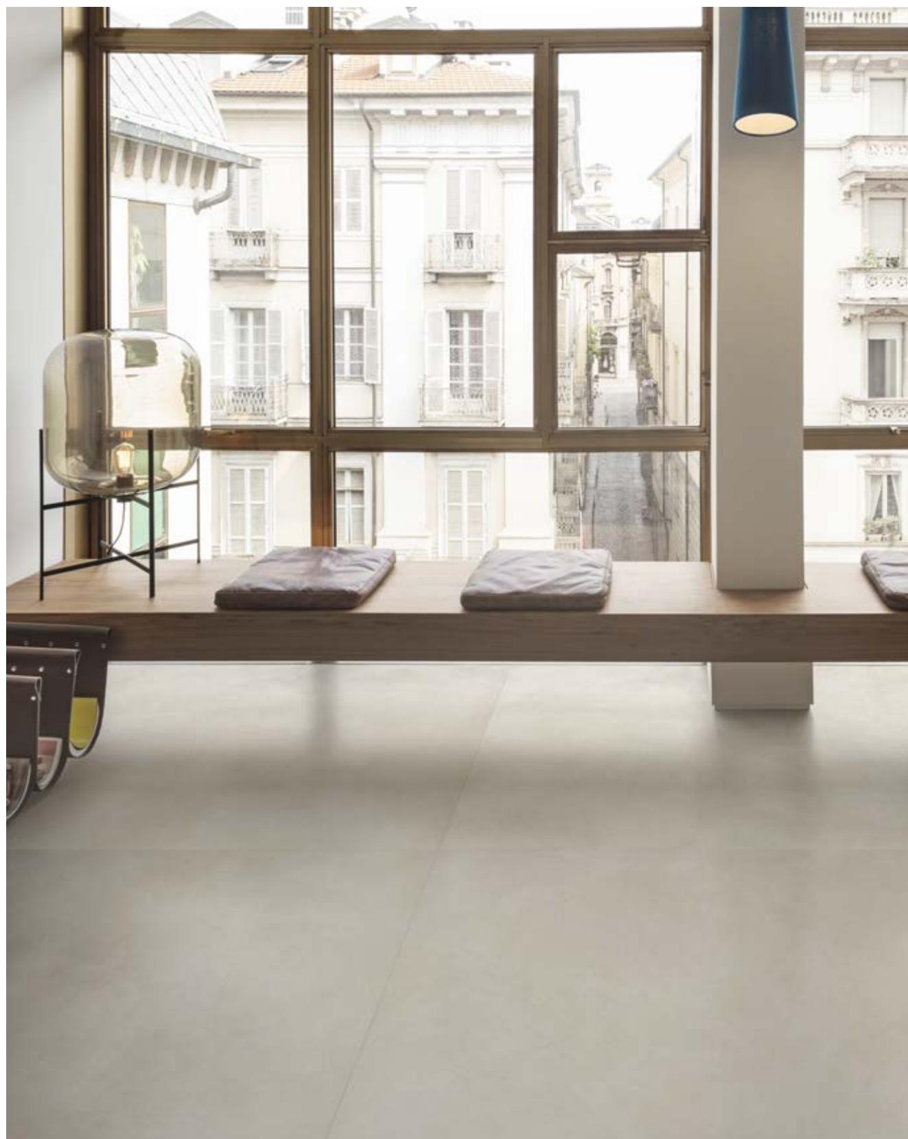
Floor Resin Look Bianco Satin