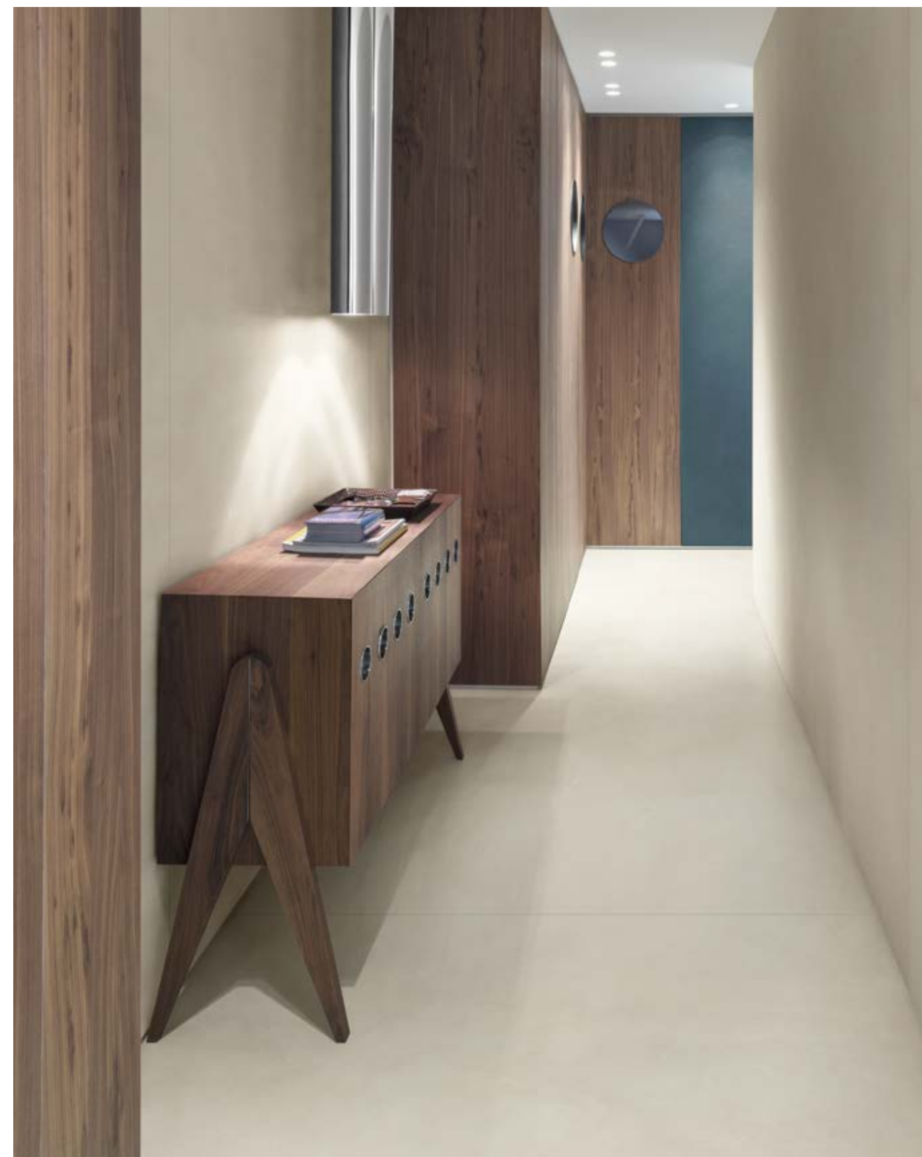
Floor & Wall Resin Look Bianco Satin Wall Resin Look Blu Cold Satin