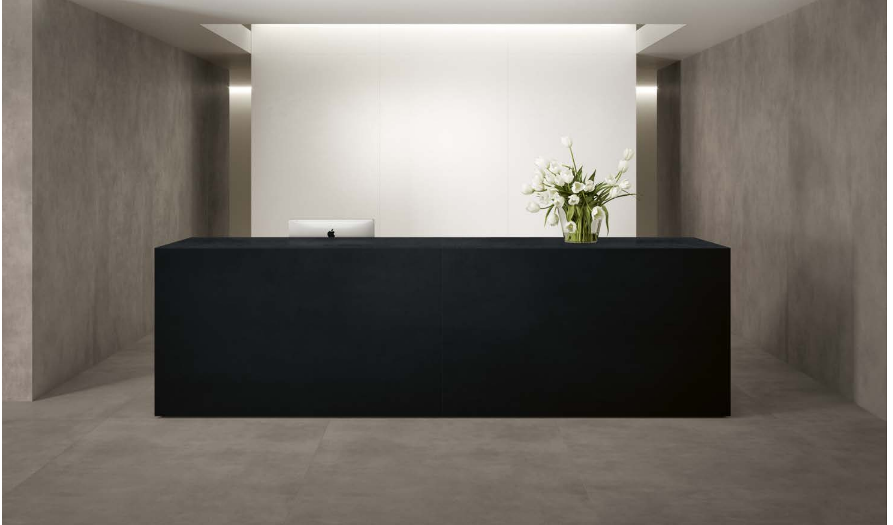
Floor & Wall Grande Concrete Look Crete