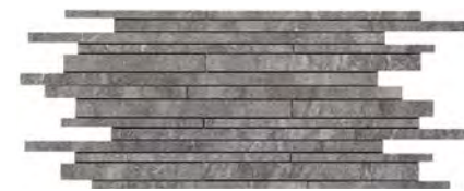
MLX0 Mosaico 30x60 (1)