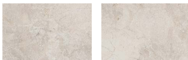
Naturale · Matt